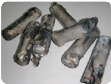
▲リチウムイオン電池の出火後